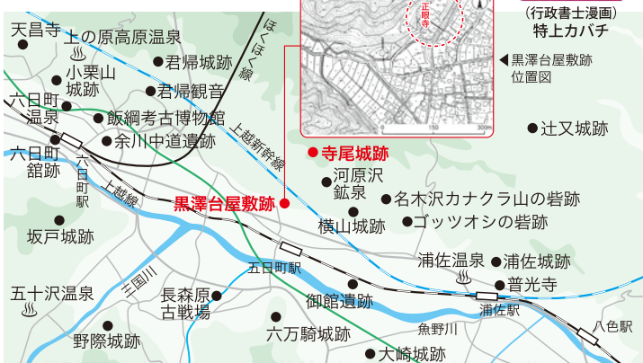
黒澤台屋敷跡位置図